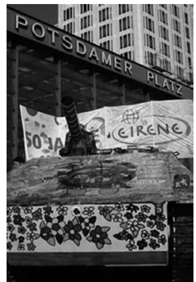
Vredestank op de Potsdamer Platz

Sinds 2002 werd in Afghanistan 85 miljard dollar uitgegeven aan militaire inspanningen en slechts 7,5 miljard dollar ten behoeve van de wederopbouw van de samenleving, aldus de kritiek van EIRENE. Dat is ook de reden waarom EIRENE samen met vele andere vredesbewegingen deelneemt aan de vrededemonstratie tegen de inzet van Duitse troepen in Afghanistan. Voor zaterdag 15 september hebben de initiatiefnemers opgeroepen tot een protestdemonstratie onder de televisietoren op de Alexanderplatz in Berlijn.