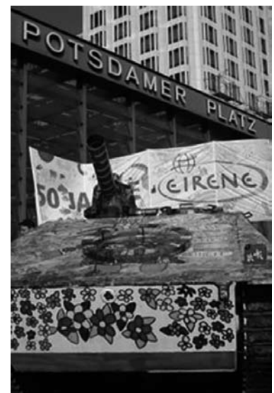
Vredestank op de Potsdamer Platz

Sinds 2002 werd in Afghanistan 85 miljard dollar uitgegeven aan militaire inspanningen en slechts 7,5 miljard dollar ten behoeve van de wederopbouw van de samenleving, aldus de kritiek van EIRENE. Dat is ook de reden waarom EIRENE samen met vele andere vredesbewegingen deelneemt aan de vrededemonstratie tegen de inzet van Duitse troepen in Afghanistan. Voor zaterdag 15 september hebben de initiatiefnemers opgeroepen tot een protestdemonstratie onder de televisietoren op de Alexanderplatz in Berlijn.