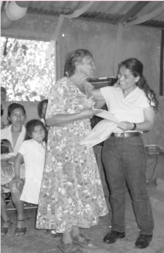
Wat donaties teweeg kunnen brengen: uitreiking van landcertificaten aan vrouwen in Nicaragua

is daarom voor het vredeswerk van EIRENE gunstig om de acceptgiro's mee te sturen. De acceptgiro's vormen - via vensterenveloppen - ook meteen het verzendadres. Het zou voor ons erg onhandig en tijdrovend zijn om sommige mensen wel acceptgiro's mee te sturen en anderen niet. We hopen dat u daar begrip voor kunt opbrengen en dat u de ontvangen acceptgiro gewoon terzijde wilt leggen als u er geen gebruik van wilt maken.