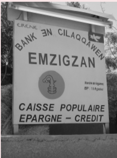
Met door Emzigzan verstrekt microkrediet investeren mensen in zaken zoals waterpompen of naaimachines.