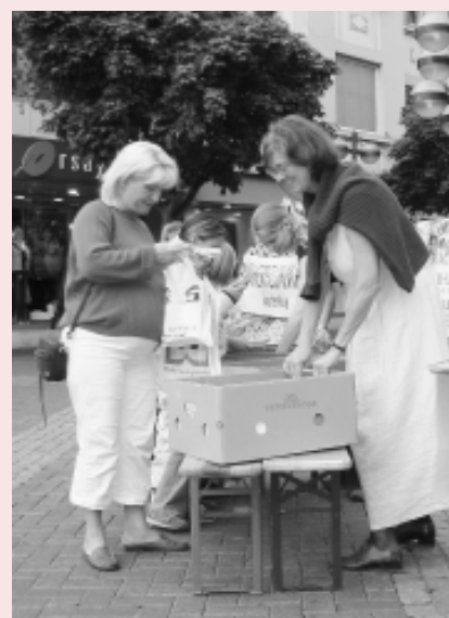
Een goed idee: verkoop van tweedehands boeken t.b.v. EIRENE-projecten in Afrika