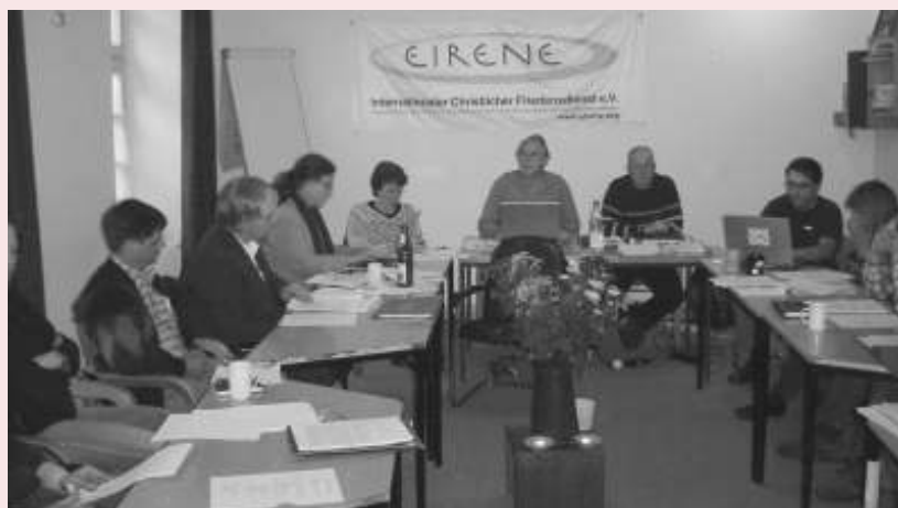
De internationale jaarvergadering in gesprek over het nieuwe grondbeginselenprogramma van EIRENE

De Council heeft het internationale bestuur opgedragen om dit voorstel verder uit te werken en uiterlijk op de Council van 2008 met voorstellen te komen. Ook is gevraagd om de huidige leden in dit proces te betrekken. Er is gekozen voor 2008 omdat EIRENE International 50 jaar bestaat in 2007 en dan alle energie wordt gestoken in het jubileum, naast natuurlijk de lopende projecten en programma's.