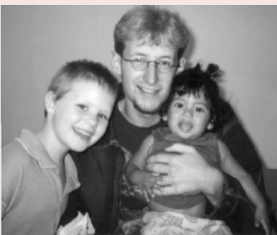
Ook families raken in de V.S. snel dakloos. In het project 'Tri-City Homeless' krijgen ze eerste opvang

Het is ook wat ik zag in de eerste weken, in mijn project 'Tri City Homeless' en mijn woonplaats Freemont in de Area Baai. Er zijn hier meer villa's dan in heel Duitsland. De auto's zijn met chroom versierd en meestal groter dan die op de Duitse wegen. De binnenstad geeft een gepolijste indruk en is mooi gerenoveerd. Dit is het beeld dat de gelegheidsbezoeker meestal mee naar huis neemt. In het begin zag ook ik alleen die rijkdom en keek ik over al die problemen zoals dakloosheid heen. Maar omdat ik hier een jaar kan blijven heb ik ook dat andere Amerika leren kennen.