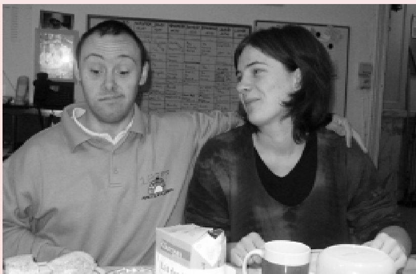
Een vrijwilliger bij de Ark-gemeenschap in Frankrijk, waar gehandicapte en niet-gehandicapte mensen samenleven

Dit heeft als voordeel dat vrijwilligers hun eigen mogelijkheden en grenzen kunnen ontdekken. Ze moeten zowel qua werk als privé oplossingen zien te vinden (overwinningstrategieën voor nieuwe uitdagingen) en zich binnen een project bewegen dat volgens andere regels functioneert dan men gewend is vanuit huis, school of werk. Dat heeft mij gefascineerd en alleen dat was al de moeite van het vrijwilligerswerk waard.“