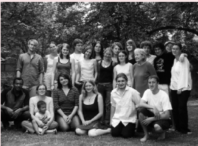
Deelnemers aan een van de twee voorbereidingscursussen in juli. Onderwerpen zoals geweldloosheid en interculturele communicatie komen aan de orde.

We wensen alle vrijwilligers een goede start in het project en veel mooie ontmoetingen en ervaringen in het gastland.