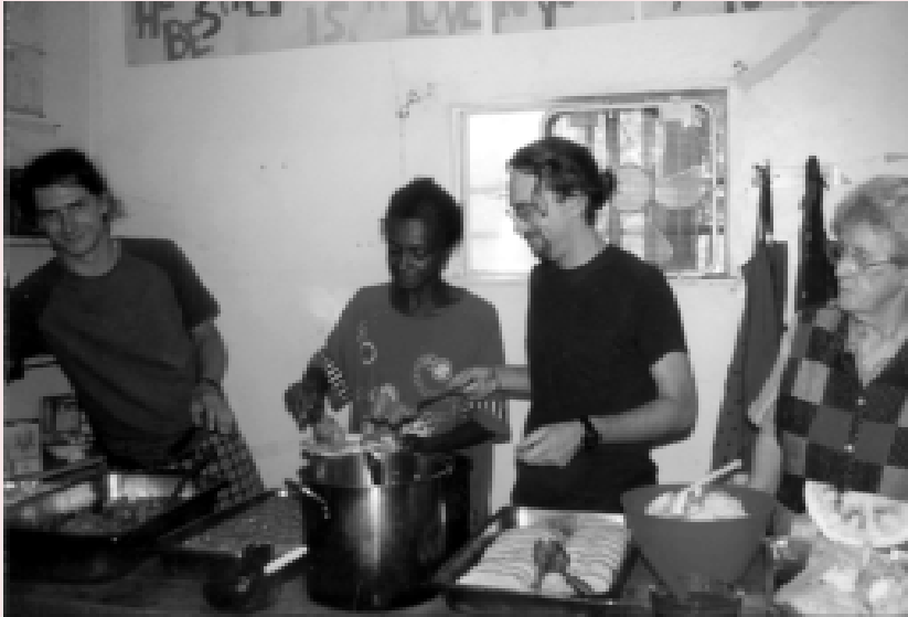
Vrijwilligers zijn voor veel sociale instellingen in de V.S. onmisbaar

de rest van de wereld over Amerika heeft. Het ene is cliché, het andere de realiteit van miljoenen Amerikaanse burgers. James kennen we van de Hollywood film. Michael kan je iedere avond in levende lijve tegenkomen als je door de straten van San Francisco loopt. Hier aan de westkust van Amerika zijn vele Michaels, die op het eerste gezicht meestal weinig opvallends vertonen. De armoede is verborgen en wordt pas zichtbaar bij een scherpere blik.