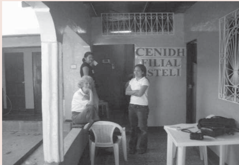
Medewerksters van CENIDH voor hun kantoor.

Zo'n zes jaar geleden is er in een stad op zo'n veertig km afstand een textiel fabriek in handen van Koreanen, neergezet op een terrein waar in de