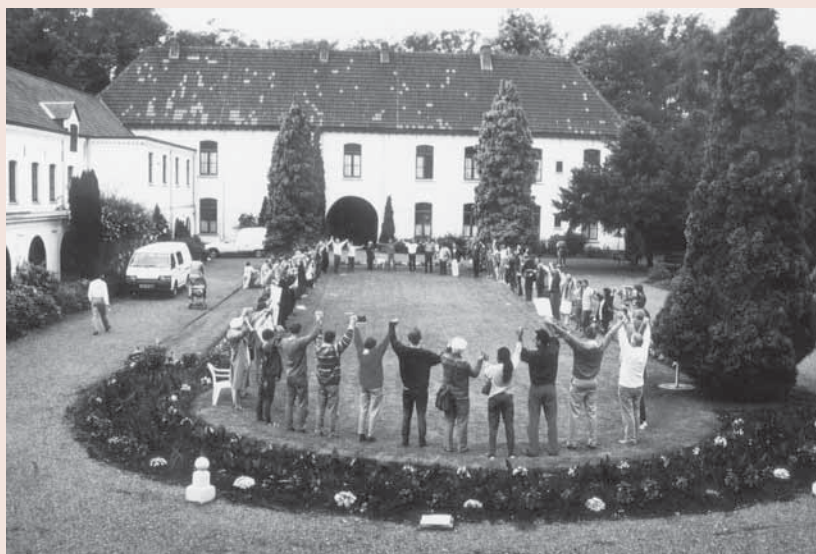
Er is natuurlijk ook tijd voor allerlei buitenactiviteiten