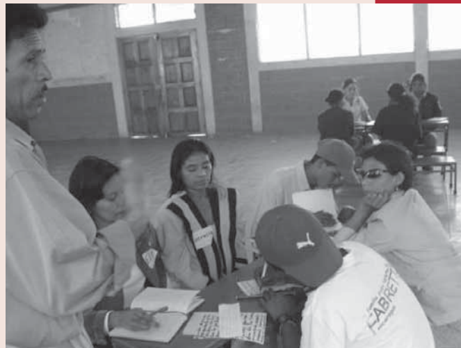
Commissie overleg in 'Cusmapa'

De rechtswinkels zoals die oorspronkelijk bestonden in Nederland, waren opgezet in de jaren zeventig om een vorm van sociale advocatuur te bieden in 'moeilijke,' sociaal achtergestelde wijken. De gangbare juridische dienstverlening was te hoogdrempelig voor de mensen die rechtshulp nodig hadden en om de drempel te verlagen werden rechtenstudenten ingezet, die zo ervaring op konden doen in hun vakgebied. Tegenwoordig zijn er nog rechtswinkels in