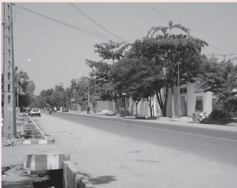
Ook op de straten van de hoofdstad n'Djamena werd gevochten